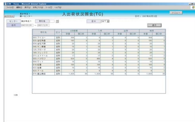
| 入出荷状況照会(TC) |