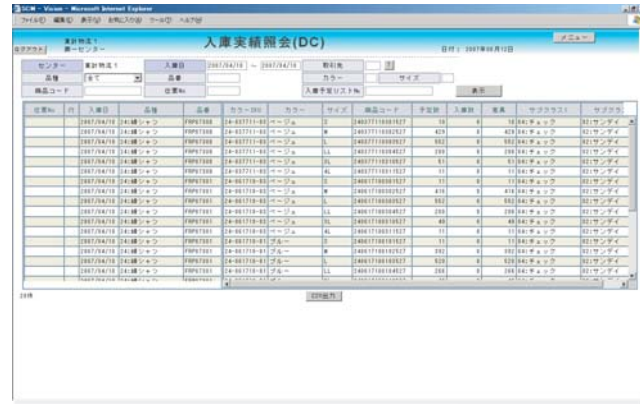
| 入庫実績照会 (DC) |