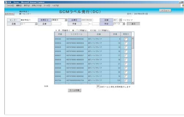
| SCMラベル発行(DC) |