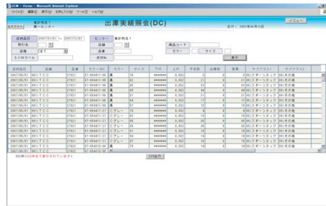
| 出庫実績照会(DC) |