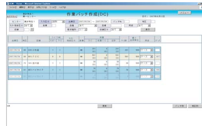
| 作業バッチ作成(DC) |