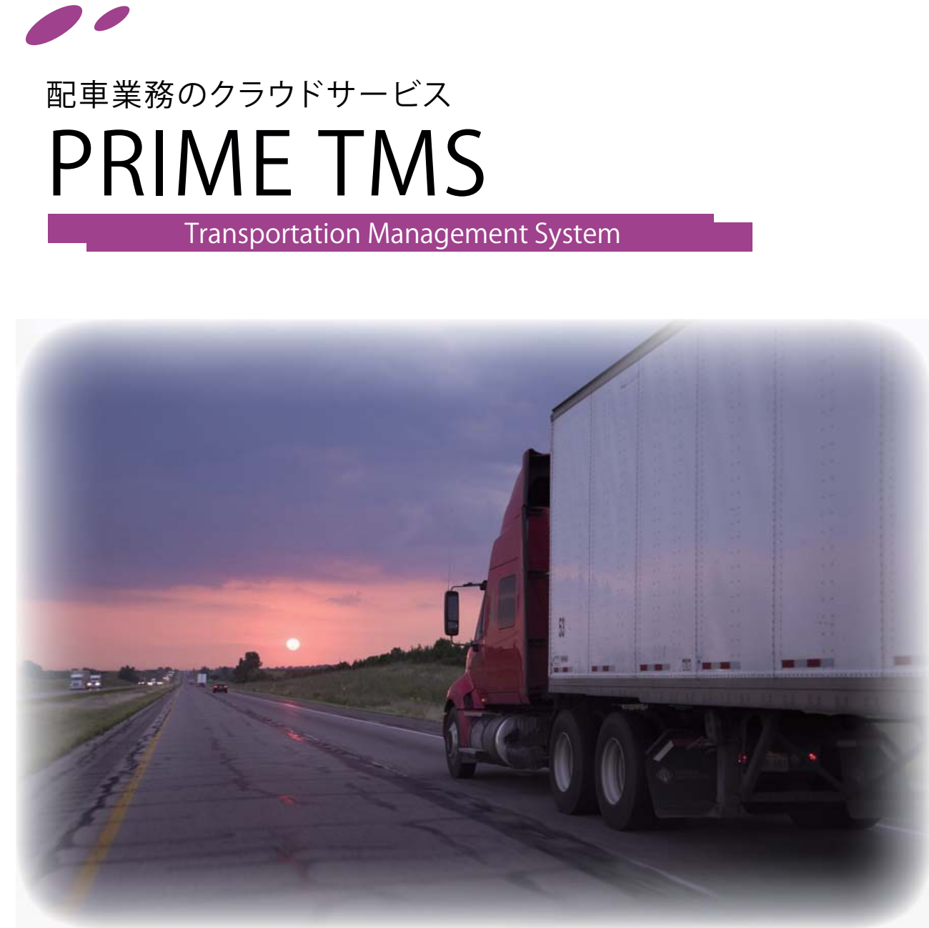
| 動態管理 |